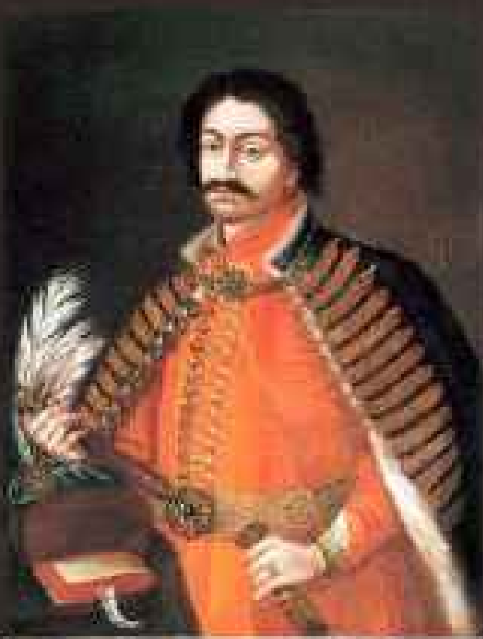
A magyar reneszánsz legnagyobb költője, Balassi Bálint.